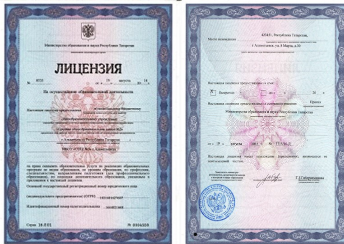
От 19.08.2016 № 8535, серия 16 Л 01 №0004559