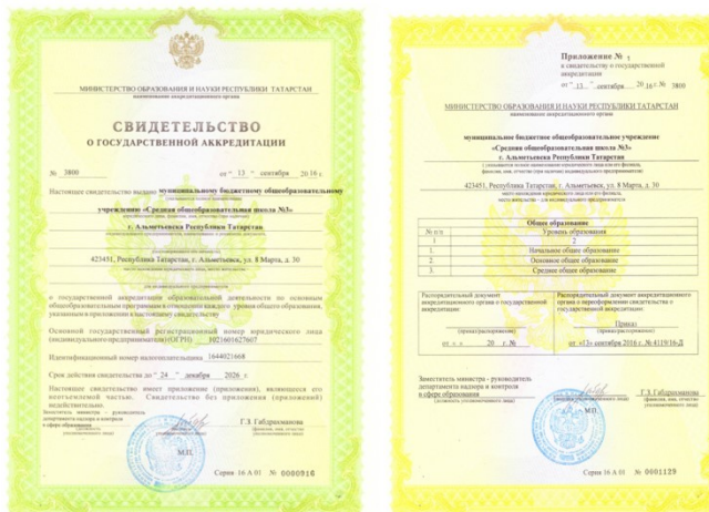
От 13.09.2016 № 3800, серия 16 А 01 № 0000916; срок действия: 24.12.2026 г.